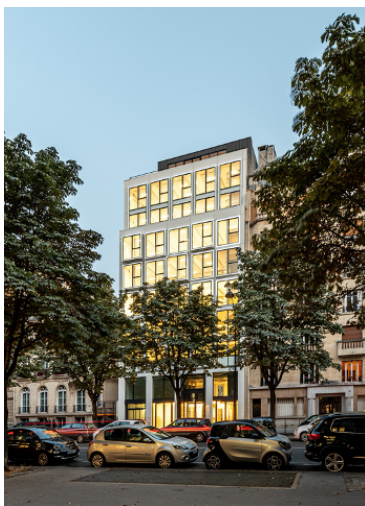
17 Hoche

Le bruit courait depuis de longs mois sur la place parisienne. SFO Capital Partners et L'Etoile Properties annoncent enfin avoir finalisé la vente du 17 Hoche à Deka Immobilien . Selon les informations de Business Immo , l'Allemand aurait déboursé près de 75 M€, dépassant le cap symbolique des 30 000 €/m 2 . La vente vient clore un cycle de restructuration lourde de l'actif entamé il y a deux ans et demi, lorsque le couple d'investisseurs s'est offert l'immeuble de 2 500 m 2 .