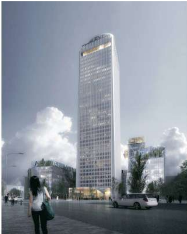
Le futur ensemble Paris Pleyel. Architecte - Sretchko Markovic @ 163 Ateliers

Parmi les premiers chantiers franciliens de nouveau opérationnels en cette période de déconfinement, les travaux de la tour Pleyel, à Saint-Denis, viennent de reprendre. Dans le respect des règles sanitaires désormais applicables pour assurer la sécurité des ouvriers, les travaux ont été relancés afin de transformer l'emblématique tour en business resort de 77 500 m 2 , tout en respectant le calendrier annoncé.