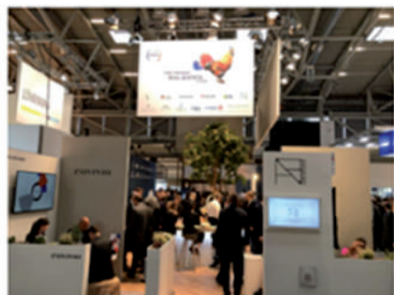
Le Club France à Expo Real 2019

Des territoires aux gestionnaires d'actifs, des architectes aux investisseurs, des promoteurs aux consultants, en passant par les start-up : le Club France a réuni à Munich, du 7 au 9 octobre, tous les secteurs de l'immobilier français au salon Expo Real . L'occasion de rencontrer 46 747 visiteurs venus de 76 pays et de présenter l'ouverture croissante de l'immobilier tricolore à l'international.