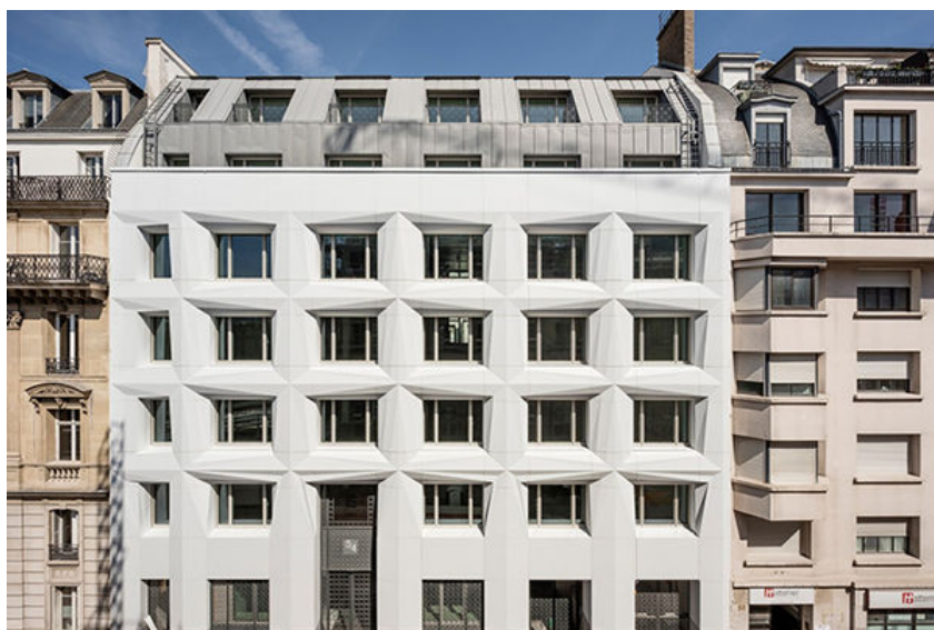
Immeuble Shift, rue de Londres à Paris, avec sa façade en Corian® Solid Surface.

L'agence Axel Schoenert architectes vient de terminer la restructuration d'un ensemble immobilier de bureaux constitué par trois bâtiments, situé au 54 rue de Londres à Paris. Ce nouvel ensemble a été rebaptisé le Shift et a été choisi par Spaces comme nouvelle implantation parisienne pour ses espaces de coworking.