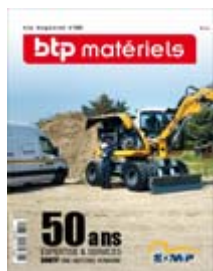
BTP Magazine Juillet 2019 N° 322