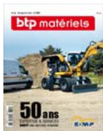
BTP Magazine Juillet 2019 N° 322