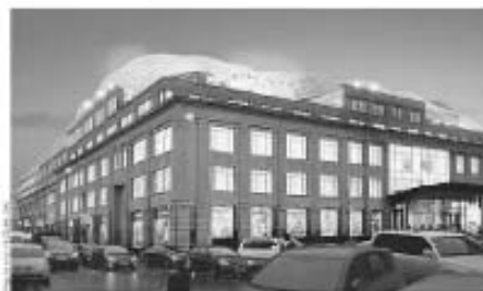
Французские архитекторы бюро Axel Schoonet Architects Associates разработали проект надстройки ЦУМа ресторанной зоны, где разместятся рестораны

На этапе с реконструкцией ЦУМа существовало три ресторанные площадки в зоне МП и рядом на Крестовый бульвар, дизайн которых также разработает ASAA, — уточнил собеседник