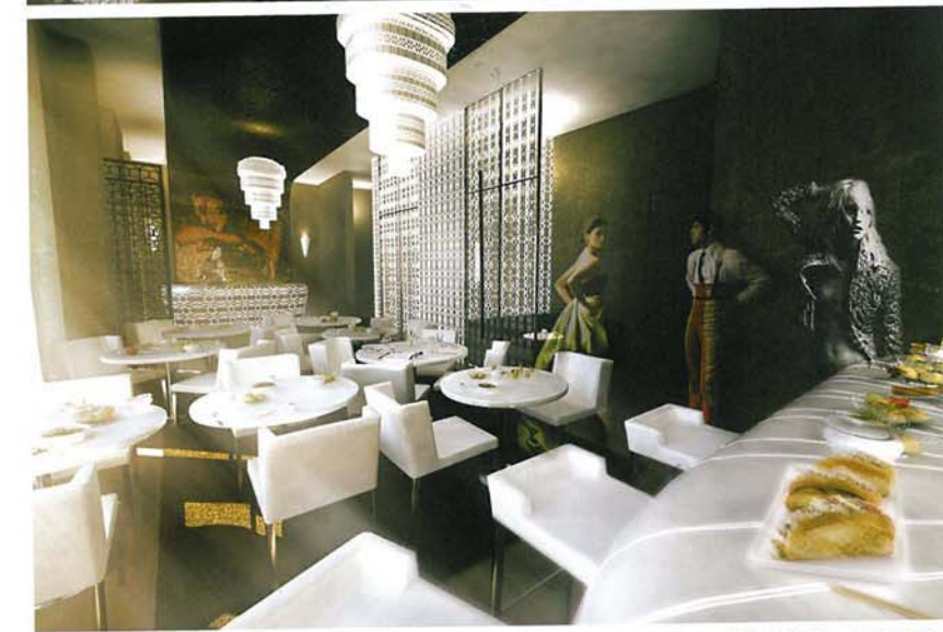
3D rendering - restaurant

프랑스 파리의 마레지구에 위치한 '호텔 가브리엘'은 편안하고 친밀한 느낌의 부티크 호텔로 '디톡스'라는 개념을 통해 건강과 신체의 재생을 실현하고자 하였다. 이에 주거공간과의 결합을 설계개념으로 설정하고 각 요소들이 완벽하게 조화를 이루는 분위기를 창조해 내었다.