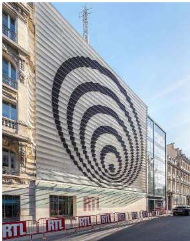
L'ancienne façade des studios de RTL, rue Bayard, dessinée par le plasticien Victor Vasarely dans les années 1970.

A l'intérieur, l'aménagement des espaces a été pensé pour répondre à l'injonction de « feelgood workplace », censé allier