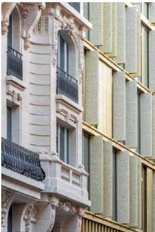
> « Maison Bayard » 22-24, rue Bayard (Paris 8 ème ) Surface : 8 200 m 2 Propriétaire : La Française Real Estate Managers agissant pour le compte de CNP Assurances Preneur : multi-preneurs

Ville Monde », notamment des sièges de grandes entreprises qui ont besoin de centralité et qui sont en recherche de jeunes talents et continuent à assurer l'attractivité de la Capitale en tant que locomotive économique de la région francilienne*.