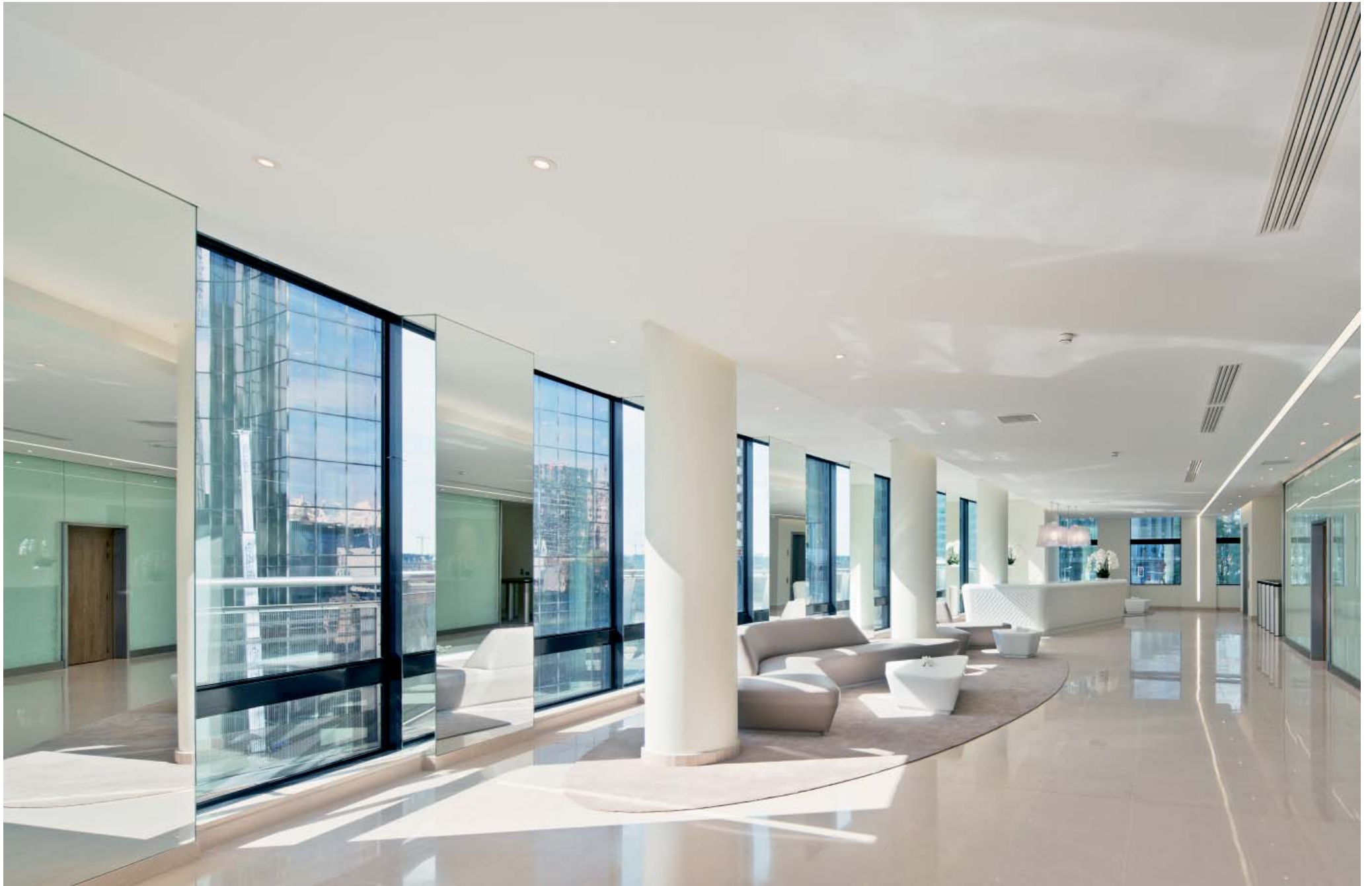
Hall d'accueil de la tour Prisma