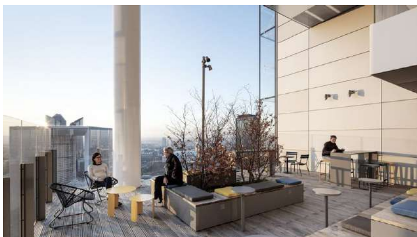
En créant son propre foncier au-dessus des infrastructures, la tour Trinity concourt à la lutte contre l'étalement urbain et fait aujourd'hui le lien entre deux quartiers.

En créant son propre foncier au-dessus des infrastructures, la tour Trinity concourt à la lutte contre l'étalement urbain, et fait aujourd'hui le lien entre deux quartiers. L'ascenseur et les paliers déportés en façade participent de son intégration dans l'environnement, comme les grandes terrasses plantées, loggias végétalisées et balcons. Même les fenêtres peuvent s'ouvrir !