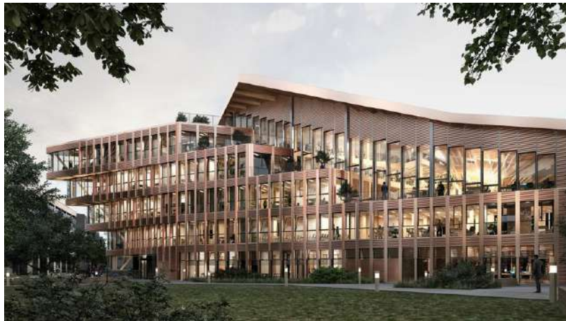
Pour le siège social de l'Office national des Forêts (ONF), actuellement en chantier à Maisons-Alfort, l'architecte Vincent Lavergne a conçu un dispositif spatial qui établit une relation visuelle entre les différents plateaux dédiés aux espaces collaboratifs. (Vincent Lavergne et Atelier WOA)

Une rue intérieure, qui facilite le repérage, connecte ce volume à un bâtiment plus classique dans son fonctionnement mais construit en bois également. L'architecte fait valoir que ce matériau (dont 85 % issus des forêts domaniales gérées par l'ONF) est une ressource pour renouveler l'architecture du bureau.