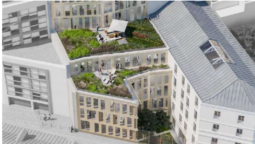
L'agence franco-allemande Axel Schoenert Architectes reconfigure actuellement un ensemble de trois immeubles rue Bayard dans le 8e arrondissement pour Nexity et LaSalle Investment Management. (Publicis Bayard)

Rue Bayard, l'opération allie restructuration lourde et constructions neuves en bois, en veillant à l'homogénéité de l'ensemble, et parvient à dégager 15 % de la surface des bureaux en espaces extérieurs.