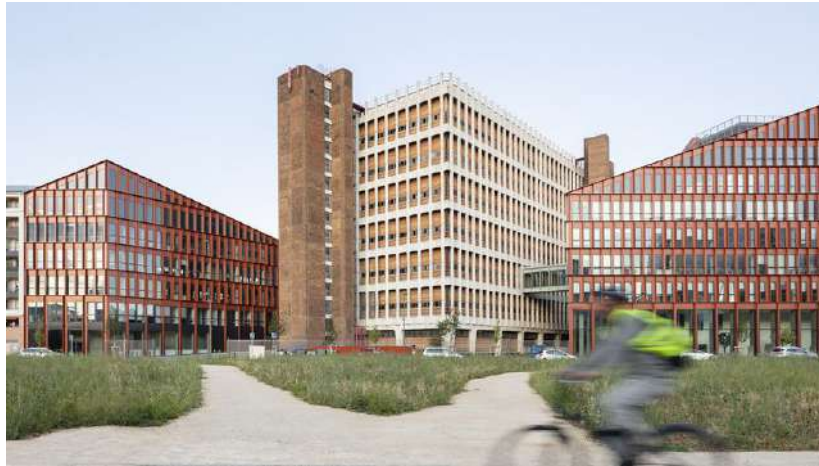
Sur le nouveau campus « Orange Lumière » d'Orange à Lyon, les 3.000 salariés évoluent dans un bâtiment paysage composé d'un ancien central téléphonique réhabilité et augmenté de deux extensions à la géométrie collinaire (Schnep Renou)

Celui de Lyon, réalisé avec l'agence HGA (Hubert Godet Architectes), encourage le travail collaboratif par l'ajout d'espaces ouverts et informels intégrant terrasses, toitures et loggias végétalisées. Comme les liaisons, ces surfaces extérieures ont été pensées en volumétrie pour « dilater » les aménagements paysagers au sol.