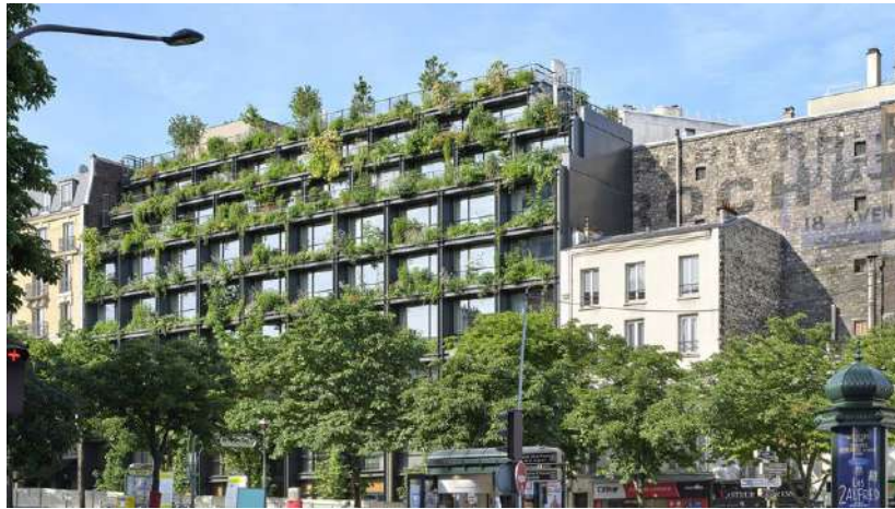
Lieu hybride destiné à la santé, la Villa M, livrée en mars dernier à Paris pour le Groupe Pasteur Mutualité, se pare d'une végétation luxuriante en façade et d'un verger sur le toit. (Michel Denacé)