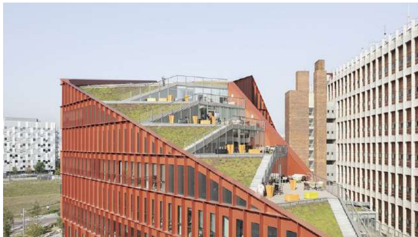
Le nouveau campus « Orange Lumière » d'Orange à Lyon encourage le travail collaboratif par l'ajout d'espaces ouverts et informels intégrant terrasses, toitures et loggias végétalisées. (Schnep Renou)