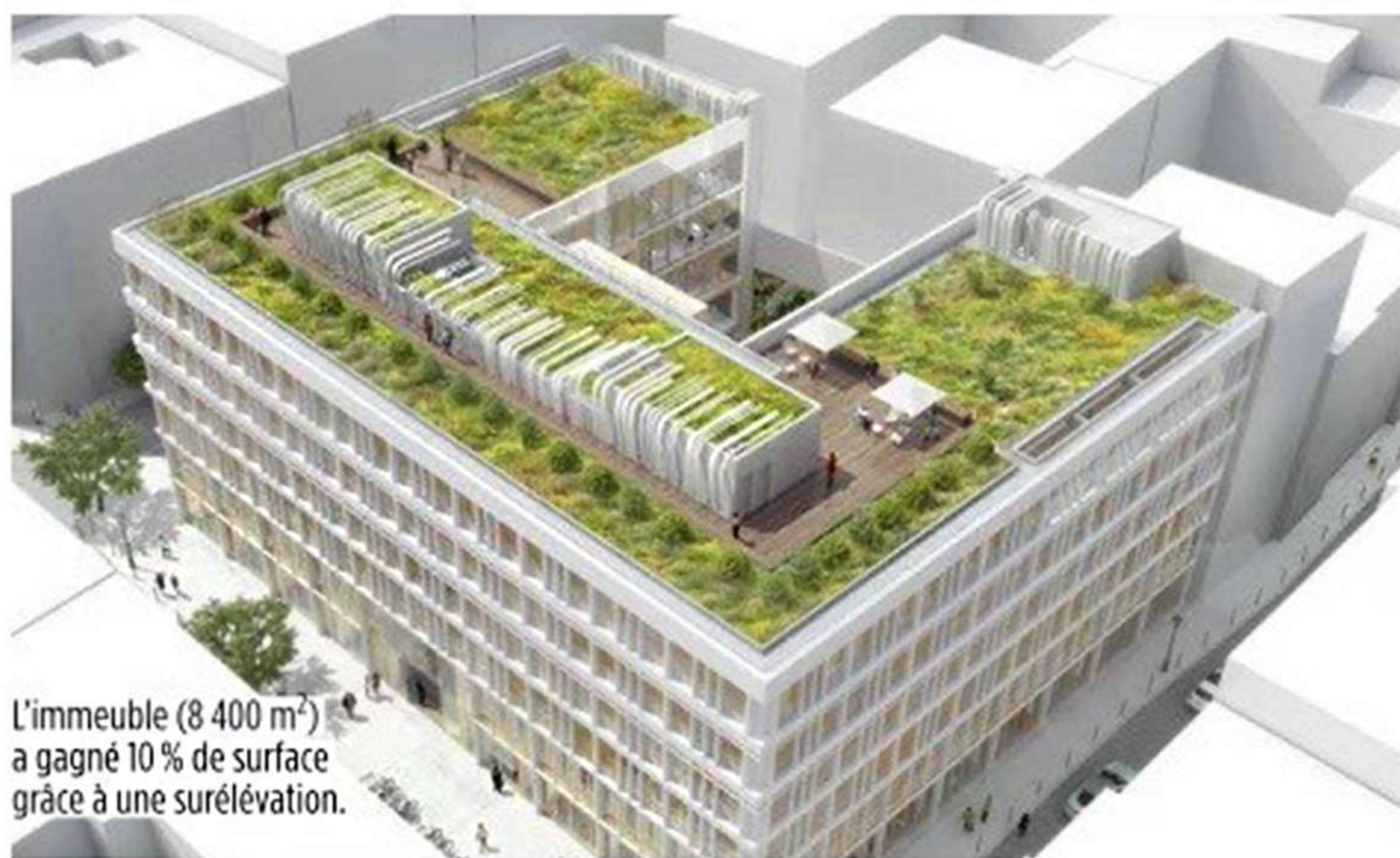
L'immeuble (8 400 m 2 ) a gagné 10 % de surface grâce à une surélévation.