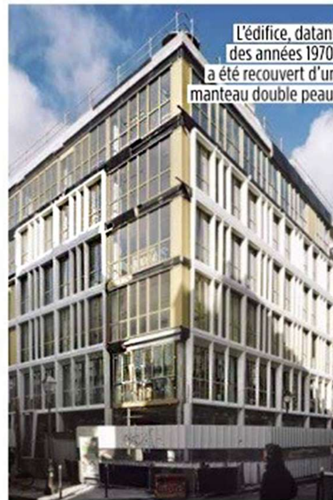
L'édifice, datant des années 1970, a été recouvert d'un manteau double peau.