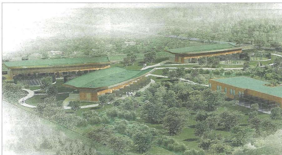
POUR BRUGHEAS. Le double projet (fourrière intercommunautaire portée par Vichy Val D'Allier et refuge SPA) n'est pas attendu avant au moins 18 mois. La SPA a prévu d'évaluer le fonctionnement de deux refuges pilotes - dont celui de Brugheas - dans une perspective de généralisation à toute la France. (ARCHITECTE)

« Le concept s'organise autour de quatre pavillons réalisés en grande partie en lamellé-collé », explique l'architecte. Il annonce aussi un « système d'énergie basse consommation » et une toiture végétalisée, pour améliorer l'isolation. Le cabinet prévoit enfin une phytostation : com-