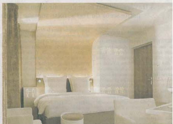
Ambiance zen et bien-être à l'Hôtel Gabriel (XI e ) qui mise sur ce concept prometteur. CHRISTOPHE BIELSA

L'autre localisation de ces nouveaux hôtels est Saint-Germain-des-Près et le Marais. La Villa Madame, rue du même nom, offre des chambres avec petite terrasse, ce qui permet de boire une coupe ou de griller une cigarette avec vue sur les courtes de Saint-Germain. Superbe. À l'Hôtel de la Sorbonne, parti pris littéraire assumé avec des pages d'écriture sur le tapis et le Panthéon couvrant la cage d'escalier. Citons encore Le Pavillon de la Reine, pour sa situation exceptionnelle : cet ancien hôtel particulier ouvre directement sur la place des Vosges. Non loin, mais aux abords du