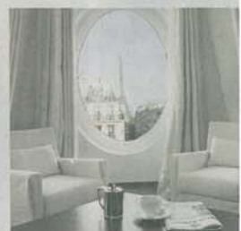
Dans le quartier du Trocad, la suite Eiffel du Metropolitan Blu (X e ) offre une vue imprenable sur la grande dame.