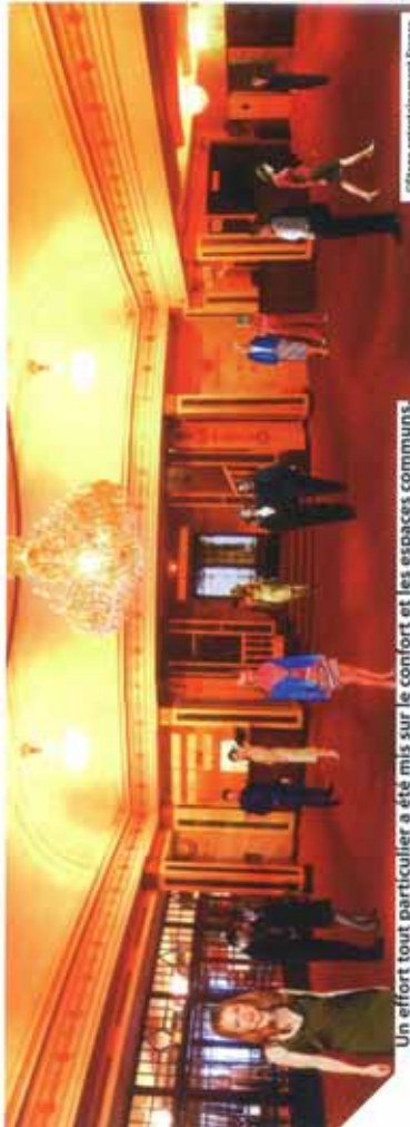
Un effort tout particulier a été mis sur le confort et les espaces communs.